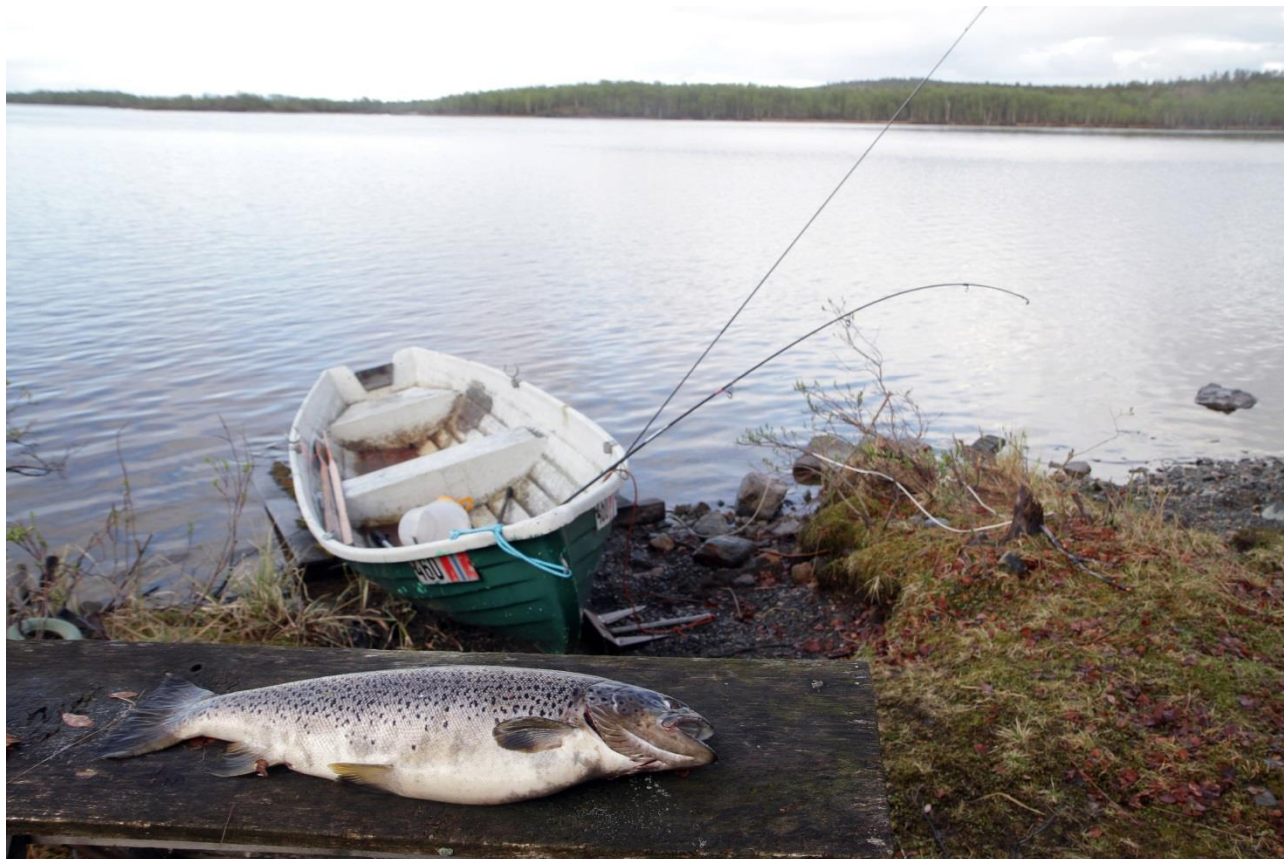
Hver fjerde fisk som ble innrapportert i 2017, var en ørret. Her er en storørret tatt på norsk side i Pasvikelva.