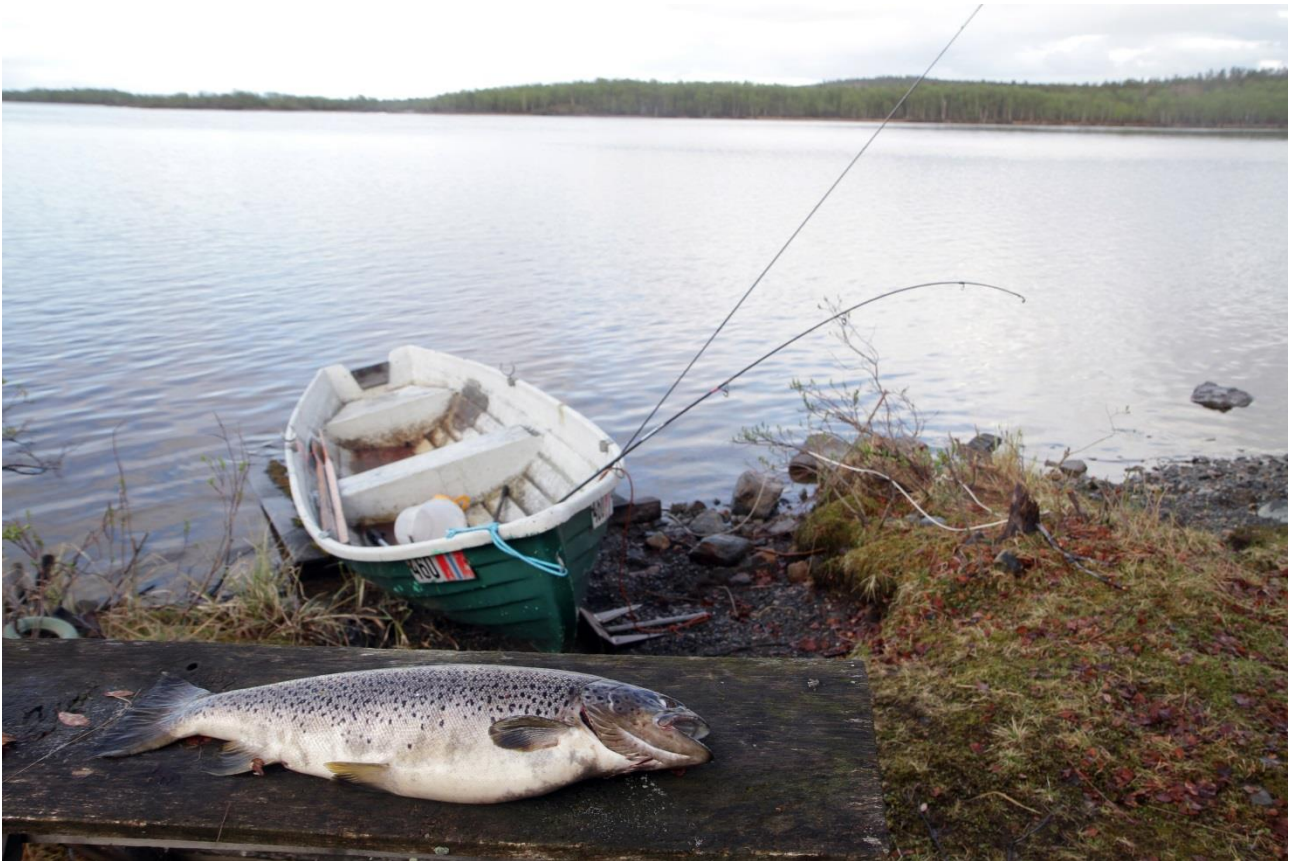
Juohke njealját guolli mii raporterejuvvui 2017:s, lei dápmot. Dá stuorra dápmot goddon Norgga bealde Báhcaveaijogas.